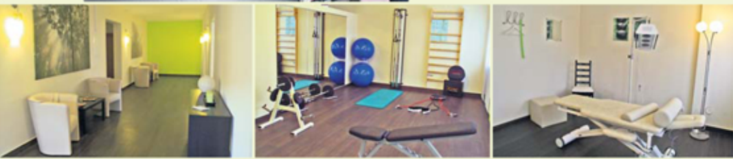
Die renovierten Räumlichkeiten an der Talstraße 14 in Klein Berkel